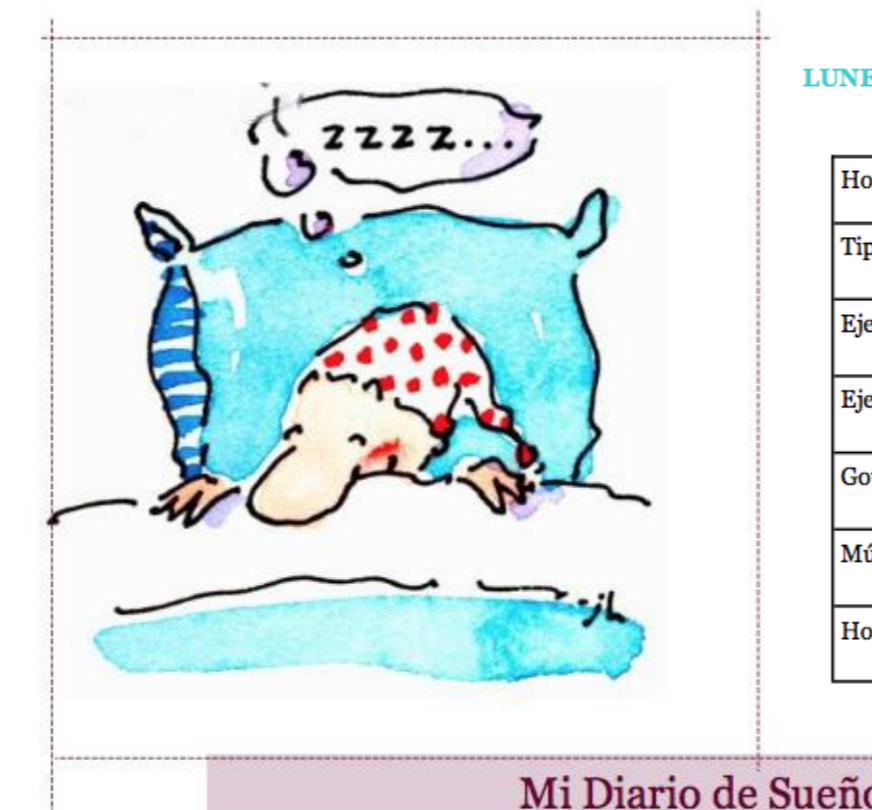
Mi Diario de Sueño

RECUERDE: En caso de tener colitis puede utilizar Hioscina de 20 mg máximo 3 veces al día. En caso de rinitis alérgica utilizar Cetirizina de 10 mg una vez al día.