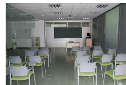
ESPACIO DOCENTE (dotado de sistema audiovisual de grabación y transmisión por la red de datos)

USO DEL AULA SIMULADA POR LAS DISTINTAS ASIGNATURAS DEL GRADO DE FARMACIA